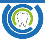
Deutlicher Unterschied: Professionelles Bleaching beim Zahnarzt wirkt!