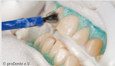
Power-Bleaching beim Zahnarzt: Auftragen des Bleaching-Gels

Wenn Sie die Praxis wieder verlassen, können Sie sich an sichtbar helleren Zähnen freuen!